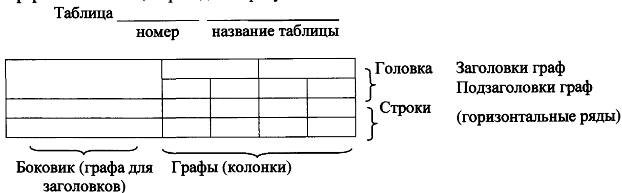
Рис. 1. Структура таблицы.

5.5. Цифровой материал, как правило, оформляют в виде таблиц. Пример оформления таблицы приведен на рисунке 1.